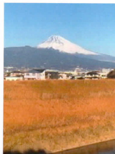
三島から見た富士山